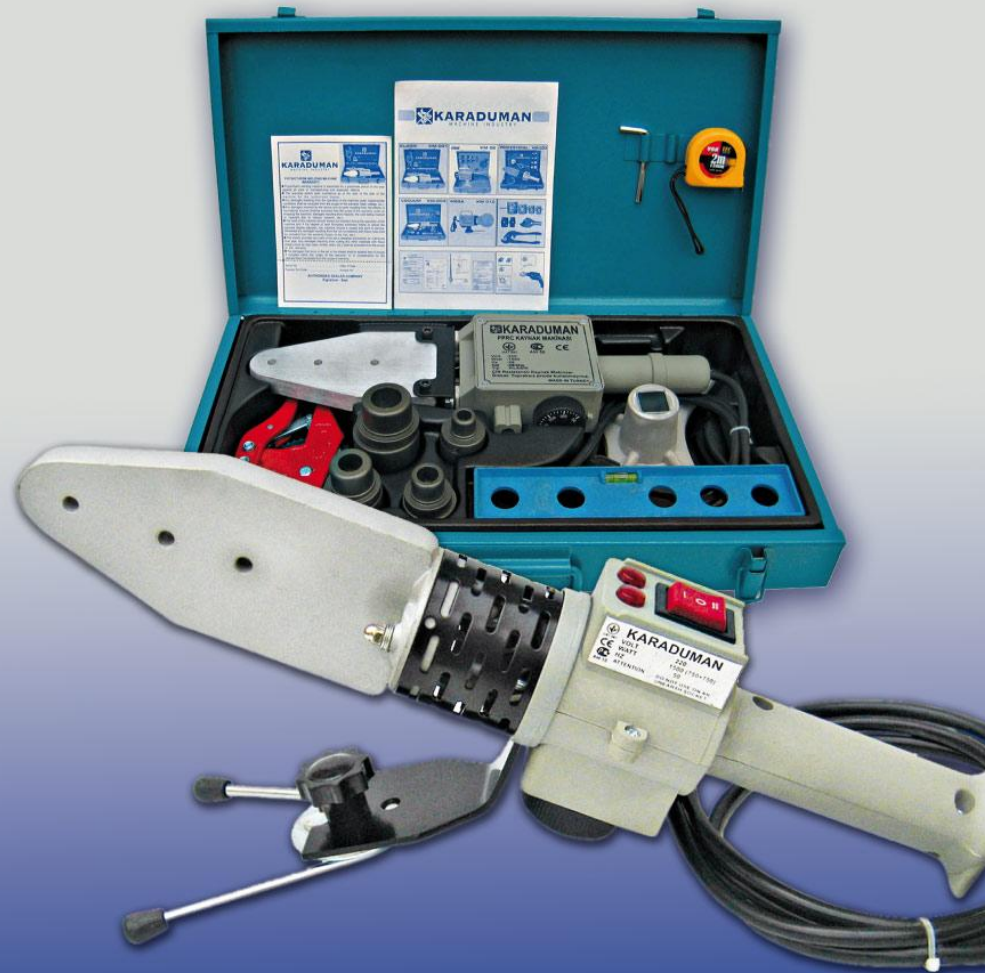
ИНСТРУМЕНТ ДЛЯ МОНТАЖА ПОЛИПРОПИЛЕНОВЫХ ТРУБОПРОВОДНЫХ СИСТЕМ